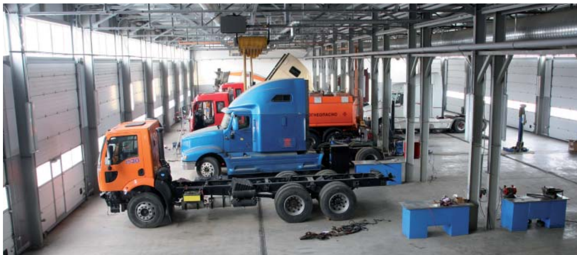
Сервис может одновременно принять до 19 автомобилей

Отдельного внимания на сервисе заслуживает кузовной участок. Уже установлена покрасочная камера длиной 20 м, которая позволяет отдельно заниматься двумя тягачами сразу или одним большим автопоездом. Заказан и оплачен стенд для правки рам и кабин. На сегодняшний день это самая мощная конструкция с суммарным усилием до 200 т. Он позволяет править даже рамы прицепов-тяжеловозов! Стенд поступит на сервис к июню месяцу, сейчас он находится в стадии изготовления.