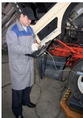
Имеются необходимые дилерские диагностические сканеры