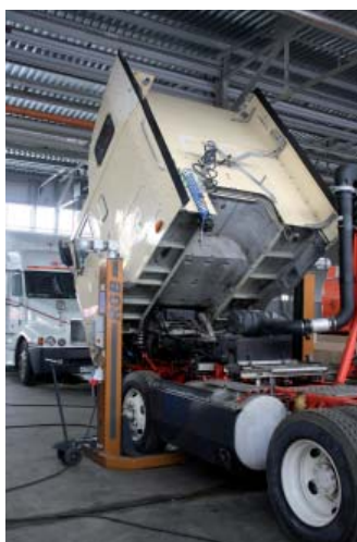
На сервисе обслуживаются американские грузовики всех типов

Естественно при работе с «американцами» на сервисе имеются необходимые дилерские диагностические приборы. Поэтому можно говорить о том, что на станции в состоянии провести качественную диагностику базовых узлов – двигателя и коробки передач на любом американском грузовике, кроме Маск. В американских грузовых автомобилях заложена своеобразная идея, когда грузовики собираются из стандартных элементов. Практически на всех американских грузовиках двигатели устанавливают от трех производителей, мосты – от двух и т.д. Из этого ряда выпадает только Маск, который до последнего времени пытался использовать только свои агрегаты, но сейчас тоже использует покупные дизели.