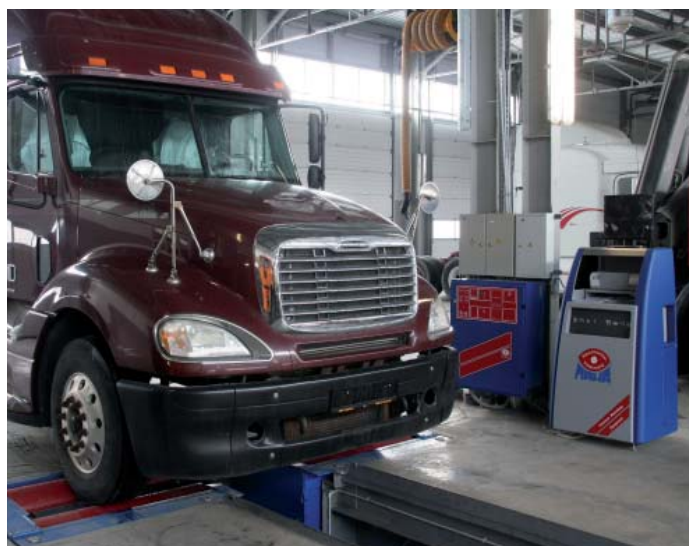
Тормозной стенд Маха

Со временем в столице стал ощущаться дефицит территории, и в середине 2007 года под грузовое отделение компания приобрела площадку бывшего Ульяновского моторно-ремонтного завода в Подмосковье. Площадка большая, более 8 гектаров, а главное она распо-