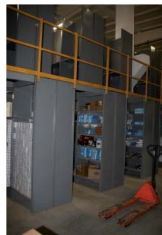
Склад запасных частей для американских грузовиков