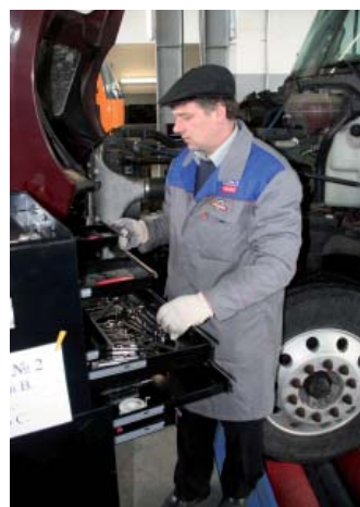
Для качественного ремонта необходим универсальный и специальный инструмент

Сервис оснащен стендом последней модели для проверки схода-развала колес у грузовых автомобилей. Это специально выпущенная модель, а не адаптированная легковая! У стенда принципиально новая система контроля параметров. Все работы осуществляются на ровном полу, где не происходит перекаса рамы или подобные явления, а для правильной оценки параметров автомобилю достаточно проехать на пол-оборота колеса вперед или назад. Преимущество этого оборудования еще и в том, что оно не установлено стационарно, его хранят на складе