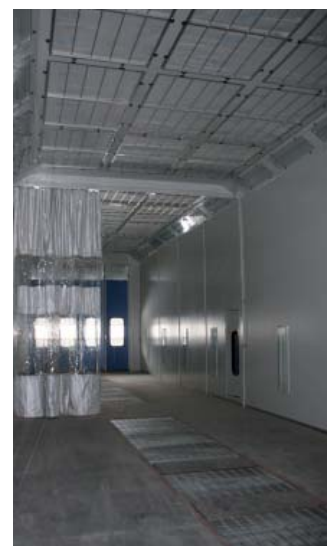
20-метровая окрасочная камера

Практика показала, что полумеры в серьезном бизнесе неэффективны, особенно если это касается тяжелых грузовиков, поэтому к оснащению сервиса в Ульяновско подошли очень серьезно. Среди установленного оборудования необходимо отметить комплекс полной диагностики Маха с тормозным стендом, рассчитанным на осевую нагрузку 18 т – на нем можно проверить любой грузовой автомобиль. Данное оборудование от ведущего производителя универсально. В дальнейшем его можно доукомплектовать более современными опциями, чтобы сервис не отставал от технического уровня автомобилей. На этой линии уже сегодня можно проводить полноценный технический осмотр грузовиков.